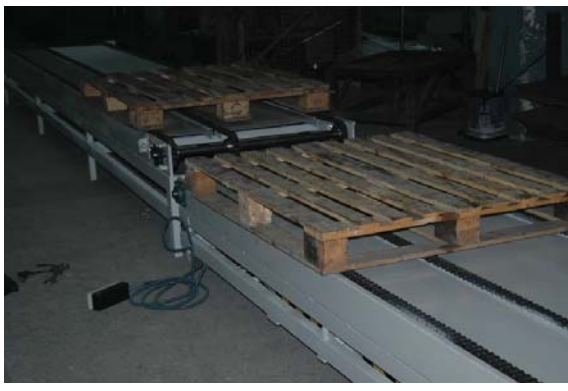
• Palet taşıma, aktarma konveyörleri