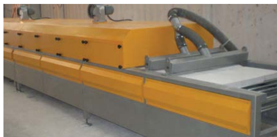
• Mermer sektöründe kullanılan tünel fırın sistemleri