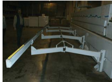
• Kenar bantlama makinası uzatma konveyörleri