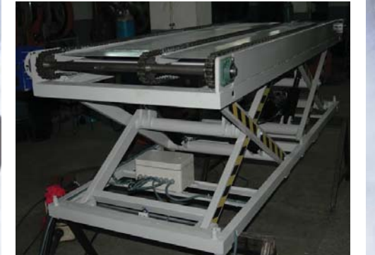
• Hidrolik liftler