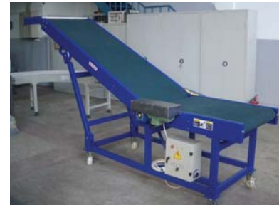
• Yükleme, boşaltma konveyörleri