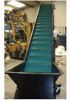
• Hazneli elevatör konveyörler