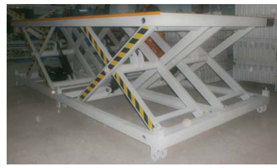
• Mobilya sektöründe kullanılan paket sunta kaldırma lifti