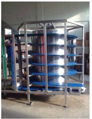
• Gıda sektöründe soğutma ve dondurma amaçlı kullanılan spiral konveyörler

Bantlı veya rulolu tipte sabit uzanımlı ve teleskobik olarak uzayarak kamyon, tır gibi taşıma araçlarının içine malzemelerin kolay bir şekilde boşaltma ve yükleme yapılmasına olanak veren konveyörlerdir.