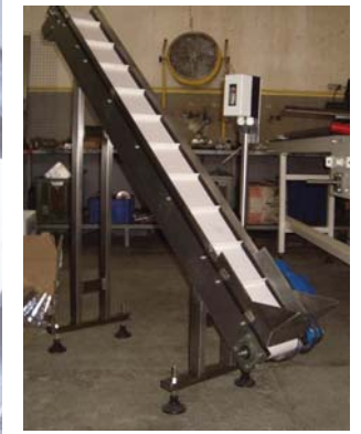
• Bakliyat sektöründe kullanılan elevator konveyörler