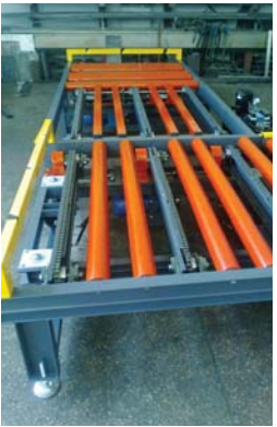
• Lojistik ve kargo taşımacılığında kullanılan ayırma ve aktarma rulolu konveyörler