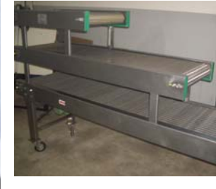
• Tel bantlı konveyörler