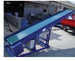
• Aşağı ve yukarı hareketli yükleme konveyörleri